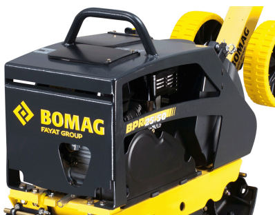
Robusto e affidabile Migliore protezione dei componenti