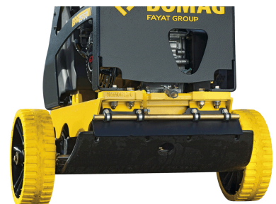
Trasporto facile e sicuro Ruote di trasporto (opzione)